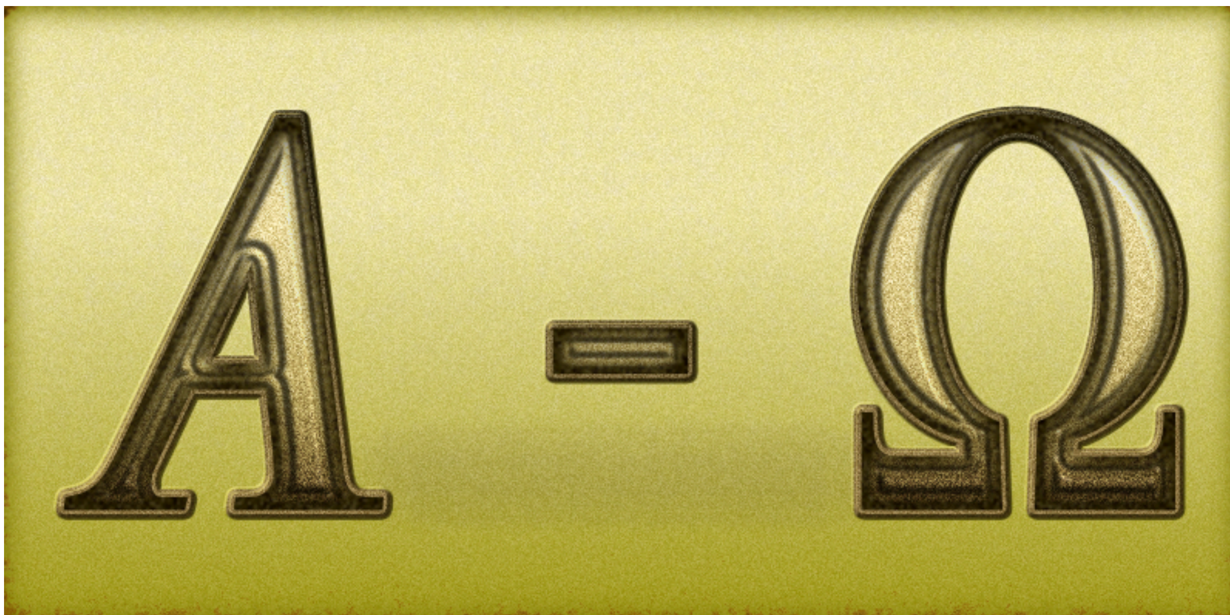
Alfa a Omega - Pán Ježiš Kristus Kráľ sveta

Pane Ježišu Kriste, uznávam Ťa za Kráľa sveta. Všetko, čo bolo stvorené, pre Teba bolo stvorené. Rob teda so mnou podľa svojho práva! Obnovujem svoj krstný sľub a odriekam sa zlého ducha i všetkej pýchy jeho i všetkých skutkov jeho a sľubujem, že budem žiť ako príkladný kresťan/ka. Obzvlášť sa zaväzujem, že vynaložím všetko, aby som právam Boha a Tvojej svätej Cirkvi dopomohol/a k víťazstvu.