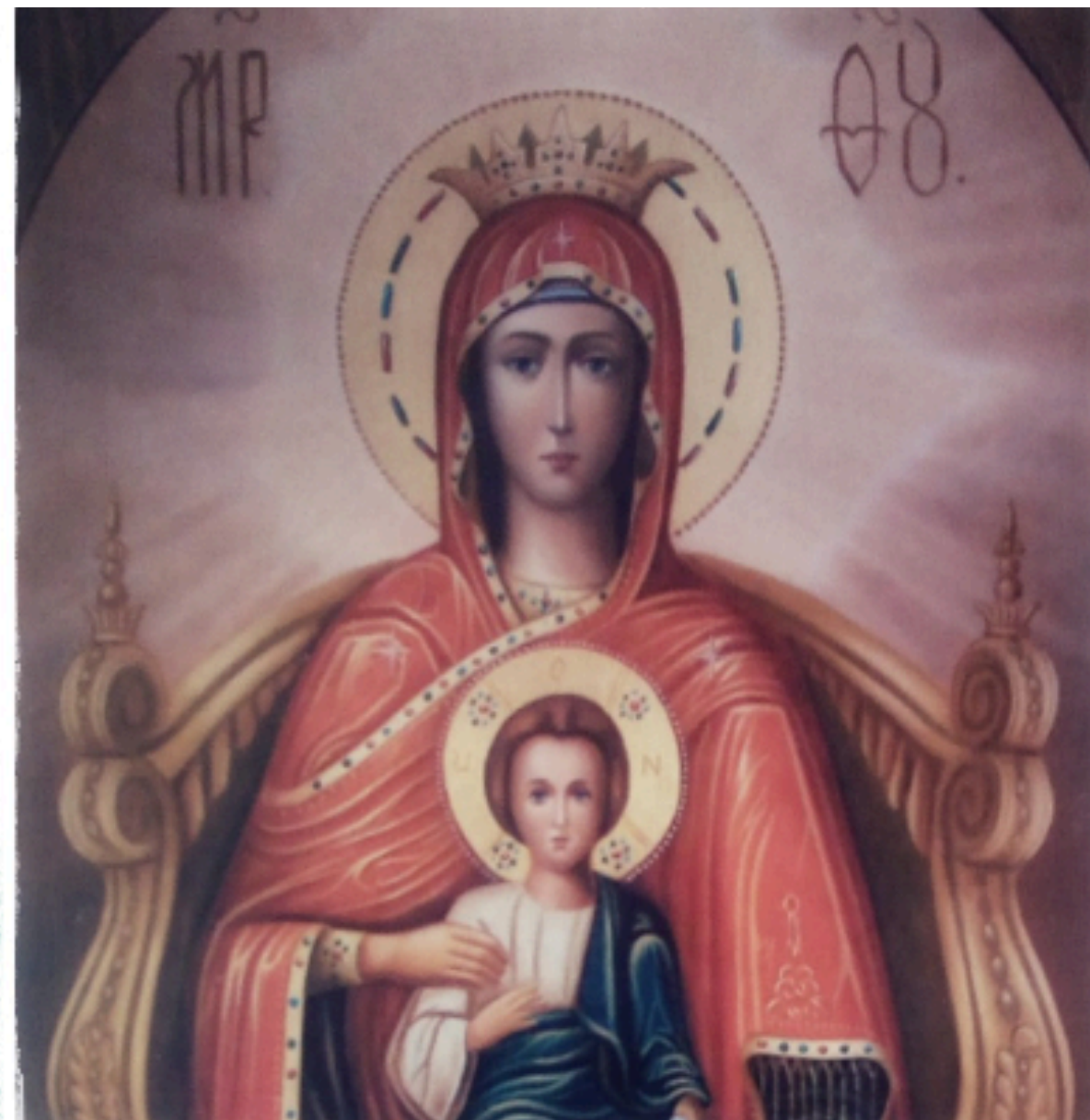
Panna Mária - Bohorodička, Nepoškvrnené Počatie, Matka Božia

10. decembra 1925 sa v cele rehoľného domu v Pontevedra sestre Lucii zjavila Panna Mária s dieťaťom Ježišom. Panna Mária jej na dlani ukázala svoje srdce ovinuté trňmi a povedala jej: Dcéra, pozri na moje srdce ovinuté trnám, ktorým ho nevďační ľudia prebodávajú rúhaním a nevďakom. Snaž sa ma aspoň ty potešiť a oznám môj prísľub všetkým,